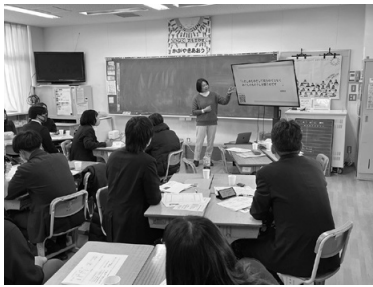
岡大附小での研究会の一場面