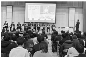
冬の道德セミナーの様子